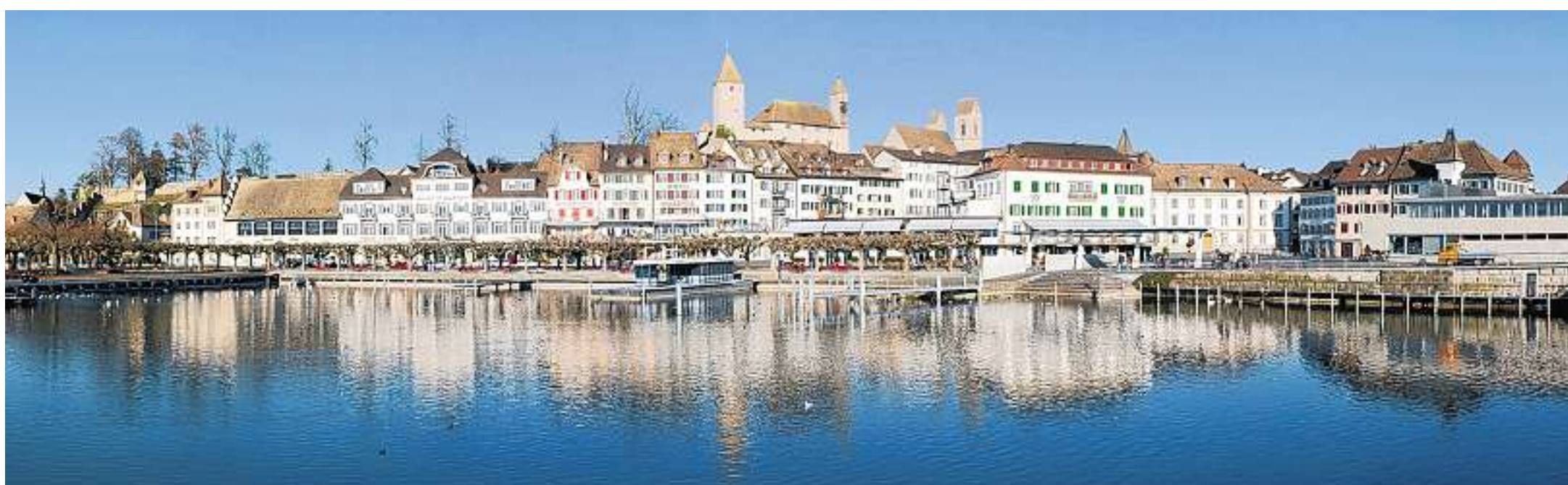
Passend: Die Altstadt von Rapperswil erhält gute Noten.