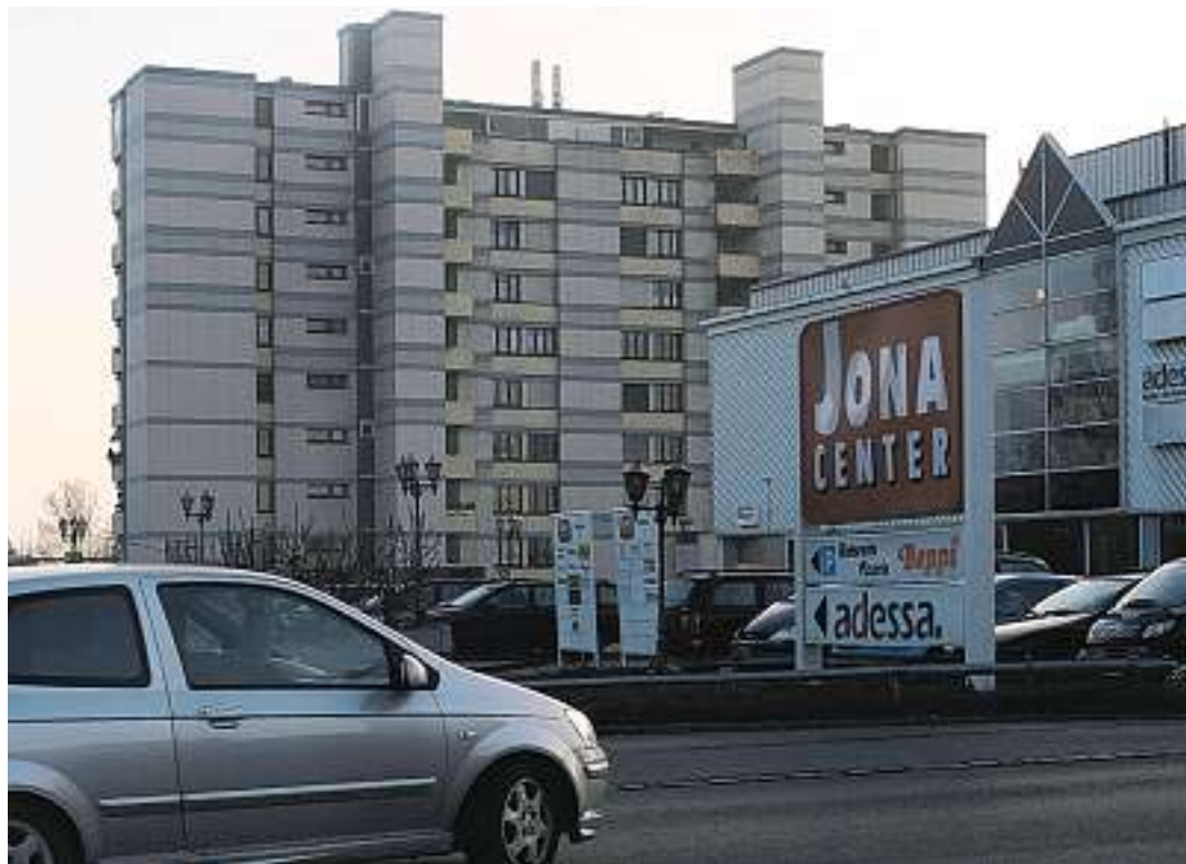
Unschweizerisch: Hochhäuser und Gewerbebauten bringen Jona schlechte Zensuren.