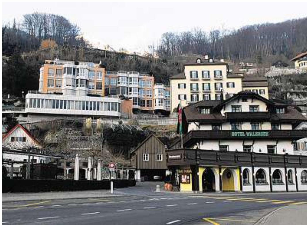
Chaotisch: In Weesen wird das Nebeneinander von verschiedenen Baustilen gerügt.

Für die Stiftung Archicultura ist klar: Grosse Teile der Schweiz gehören baulich zu den hässlichsten Gebieten Europas. Im Kanton St. Gallen werden die Agglomerationen gerügt – und nicht nur sie.